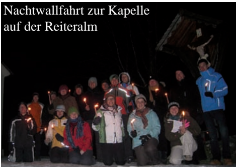
Nachtwallfahrt zur Kapelle auf der Reiteralm