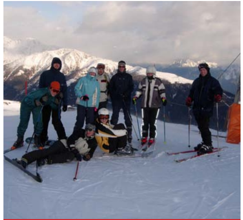
Klagenfurt im Februar 2008

Zuerst einmal ist das Fundament einer echten Freundschaft eine gegenseitige, wohlwollende Liebe, also ein Willensakt - nicht etwa ein Gefühl oder eine Sympathie. Aristoteles bemerkt, das Wohlwollen ist das Prinzip einer wahren Freundschaft. Darin darf es keinen Egoismus geben. Sucht jemand in einer Freundschaft nur den eigenen Vorteil, dann zerbricht diese, sobald die Vorteile verschwinden, seien es Geschenke, Geld, Vergnügen usw. „Töte die Eigenliebe, dann ist die Freundschaft auferstanden“, schreibt Bischof Sailer. Nur wer bereit ist zu geben, selbstlos zu geben, der ist fähig für echte freundschaftliche Beziehungen. Und solche Freundschaften bleiben auch in schlechten Zeiten bestehen. „Wahre Freundschaft kann nicht wanken...“ So lautet ein Lied im Cantico. Aristoteles bemerkt, dass sich Freunde nicht nur gemeinsam freuen, sondern auch gemeinsam trauern. Wahre Freunde freuen sich mit, wenn es einem gut geht; aber sie bleiben auch treu, wenn es einem schlecht geht. In der Not erkennt man den wahren Freund, oder wie es in